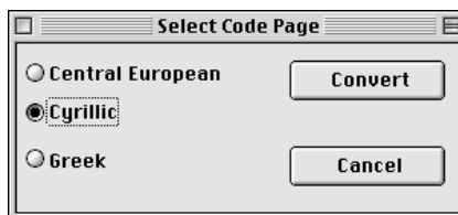
фиг. 2 - Екрана се появява при стартиране на макроса.

След стартиране на макроса, на екрана се появява диалогов прозорец (фиг. 2). Макросът работи върху селектиран текст, ако има такъв или върху целия документ, ако няма селектиран текст. Необходимо е да изберете съответната Macintosh кодова таблица (code page), към която ще бъде конвертиран текстът при транслация ASCII => Unicode.