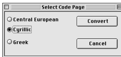
Picture 2. The window appears when you start the macros.

With CPC macros you will translate the selected text if any text is selected or all the text if there is not selected text. When you start the macros, a dialog window with the conversion direction appears, picture 2. In this step you must select the Macintosh code page for the output document. The selected code page determines to which code page will be converted the selected text. This selection is critical for the proper translation. For example, if you know, that the old document has been set in Cyrillic, you must select Cyrillic code page for that translation.